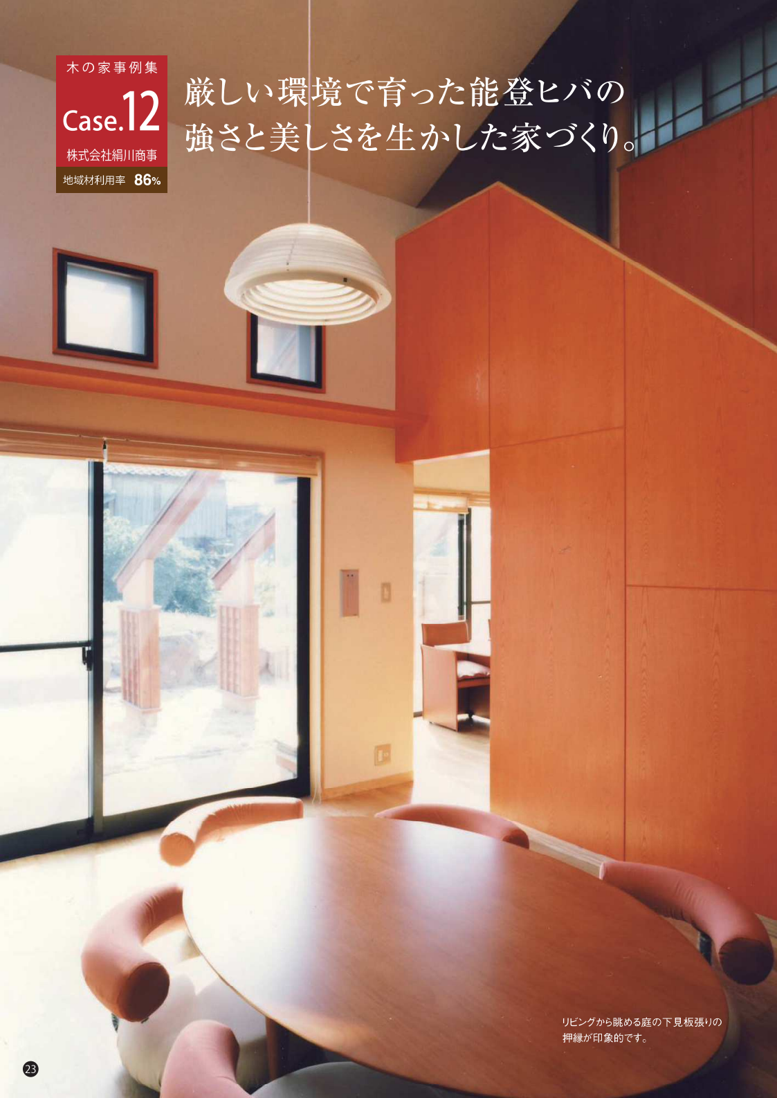
リビングから眺める庭の下見板張りの押縁が印象的です。