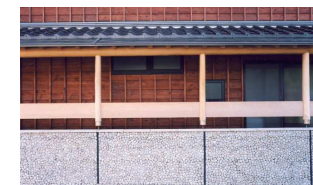
重厚な和瓦と能登ヒバの構造材、伊勢コロ太石貼りの塀。上質な素材を生かした用の美が、建物に品格を与えてくれます。