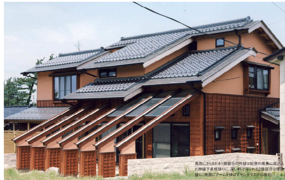
風雨にさらされる1階部分の外壁は能登の風景に溶け込む押縁下見板張りに、深い軒で守られる2階部分は厚塗壁に、南面にアームを伸ばすサンテラスが印象的。