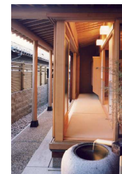
雪見障子や水屋をしつらえた8畳の和室から、畳敷きの縁側を介して外庭へ。能登ヒバは耐候性に優れているため、外部構造材にもアラワシで使用しています。