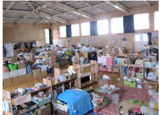
東日本大震災の避難所での組手什活用事例