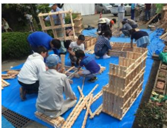
子供や女性・高齢者でも組み立てられます